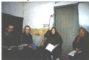
Неужели ради нас напечатали Евангелие таким крупным шрифтом?»

— Послушайте меня, — заговорил взволнованный гость, — я видел сон: ко мне пришел ангел и сказал: "Иди к этим людям, они тебе скажут Божью правду. Если не пойдешь — погибнешь". Скажите, это добрый ангел? Он белый или черный?