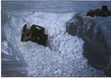
Ровняли путь (25 м), чтобы выехать из рва.

При ударе двигатель подался вперед, что и спровоцировало эту поломку. К счастью, у нас была в запасе эта деталь. Снова — лязгание ключей, обжигающий холодный металл. Сделали. Машина завелась и медленно поползла вверх. На третьи сутки в шесть часов утра по якутскому времени машина выбралась на поверхность. Забрались в работающую машину, чтобы согреться, помолились и сразу уснули. Проснулись от холода. Ветер усилился настолько, что на него можно было ложиться. Через щели он выдувал из салона все тепло и не позволял двигателю нагреться. Топливо и продукты были на исходе, но затяжная пурга не утихала. Что делать? Ожидать в машине — значит сжечь последний бензин. Тронуться в путь — при такой погоде не проедем и километра. Как быть? Мы приняли решение вновь спуститься в ров. Выкопали в снегу большую нишу, чтобы укрыться от пурги и поесть. Спустились в нее и стали ожидать Божьего определения наших судеб. Пошли четвертые сутки нашего пребывания во рву. Ели один раз в сутки, экономя продукты. Для питья растапливали снег и теряли силы от этой безсолевой воды.