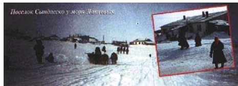
Поселок Сындасско у моря Лаврентия