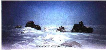
Множество ледяных торосов

льдины настолько остры, что о них легко порезать не только шины, но и руки. Ширина залива 10 км. С большой осторожностью мы пробирались среди этих торосов, боясь повредить колеса. Молились, чтобы Господь провел нас через эту опасность невредимыми. Наконец торосы закончились и перед нами раскинулась белоснежная гладь тундры. К утру впереди показались серые пятна домов. Это был поселок Сындасско (в нем проживает 600 жителей).