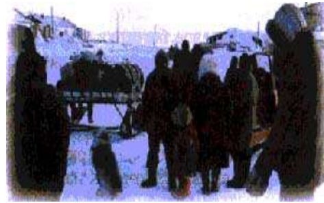
Жители поселка провожают благовестников.

залив застывает, ошестинившись острыми, как бритва, кристаллами, торчащими изо льда. Их называют торосами. Эта суровая импровизация ветра и мороза красива, но очень опасна. Иные