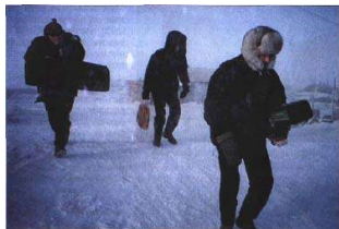
Благовестники, несмотря на метель, ходили из дома в дом

Остальные, несмотря на метель, ходили с благовестием из дома в дом и обошли весь поселок, насчитывавший восемьсот жителей. Дарили людям Слово Божье, беседовали и приглашали на богослужение.