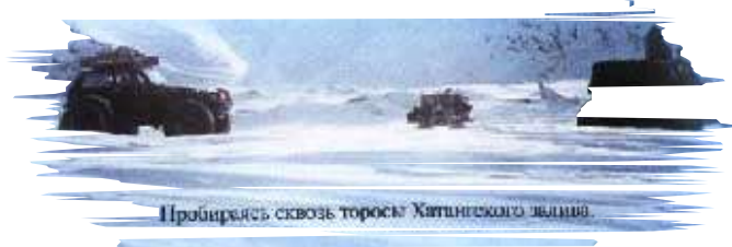
Пробирясь сквозь торосы Хитинского льдина