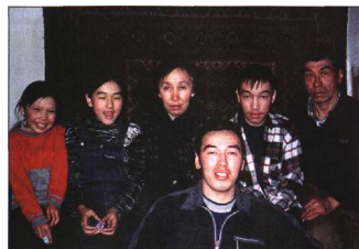
Семья долган, гостеприимно приютившая благовестников.