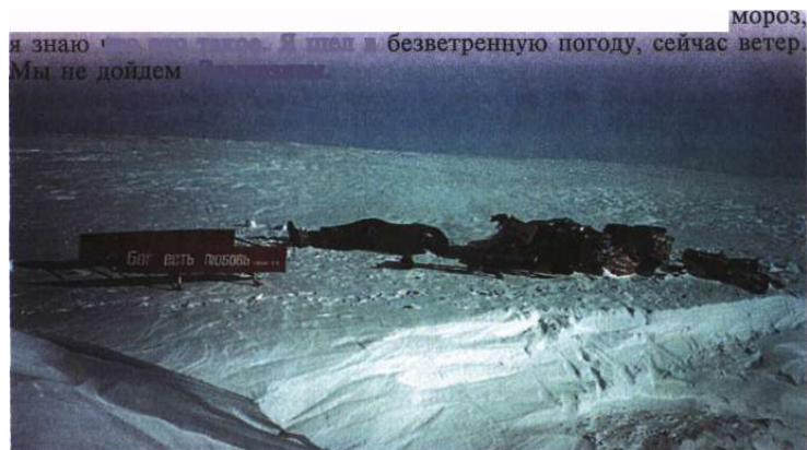
Первый благовестник нашего братства отдал свою жизнь ради спасения якутов.