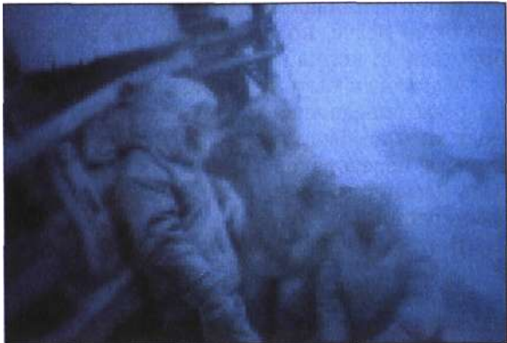
Чтобы спастись остальным, нужно было что-то делать, а братья обессилели.

—Сколько мы отъехали от поселка? — спросил один из братьев. —По спидометру пятьдесят два километра, — ответил я.