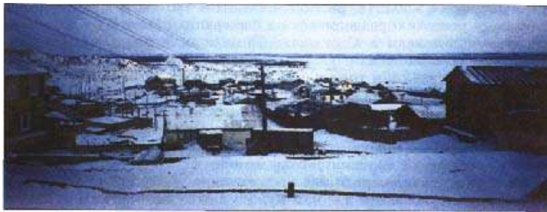
Две недели трое братьев благовесговали в поселке Саскылах.