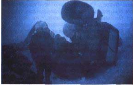
Внезапно под нами оборвалась земля. Машина перевернулась.